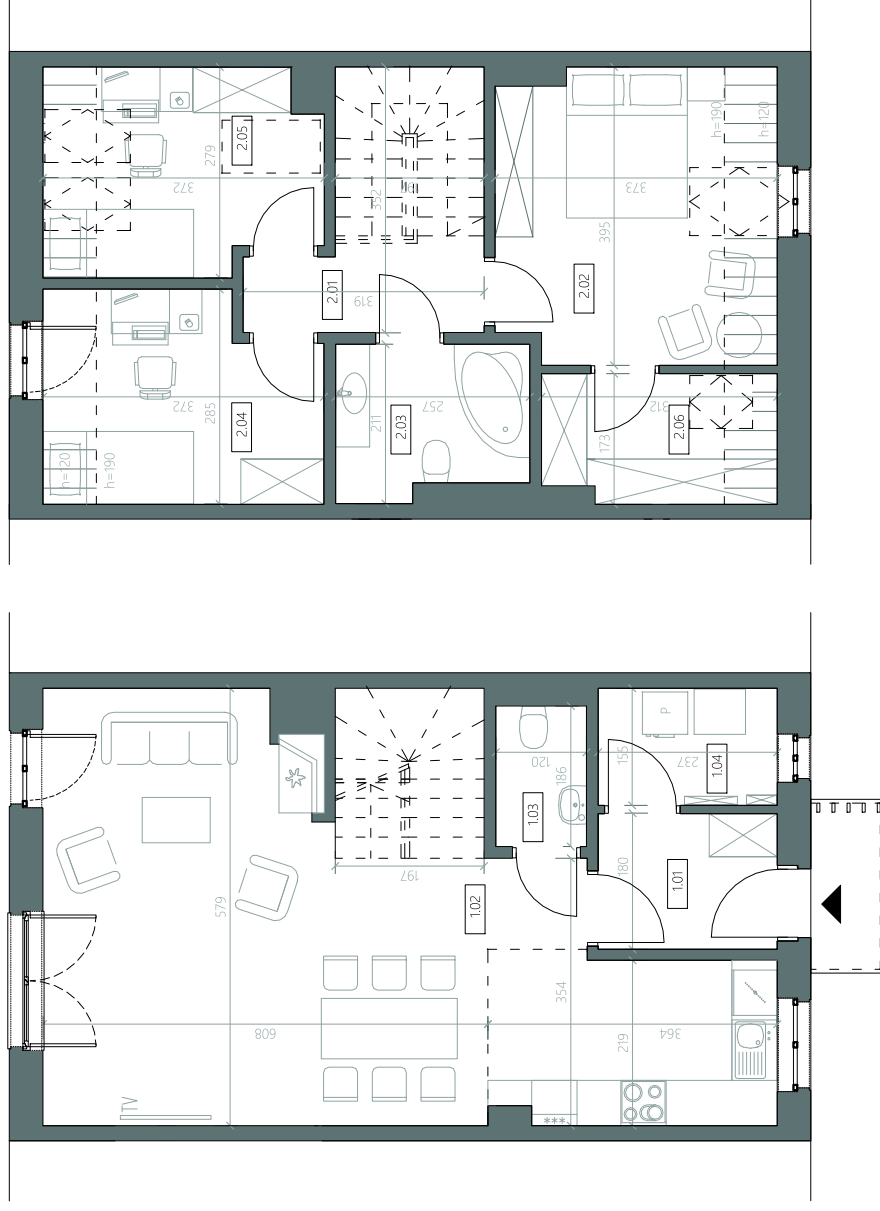
rzut parteru 1:100